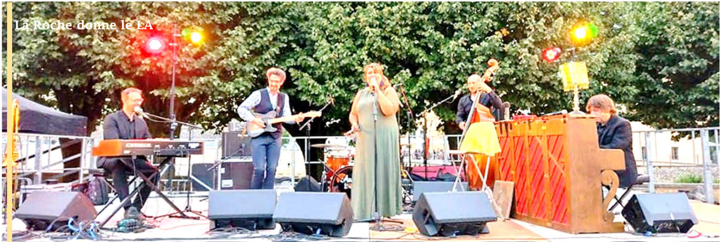
La Roche donne le LA