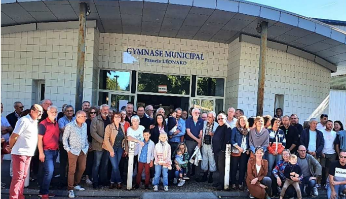
Baptême du gymnase municipal Francis Léonard