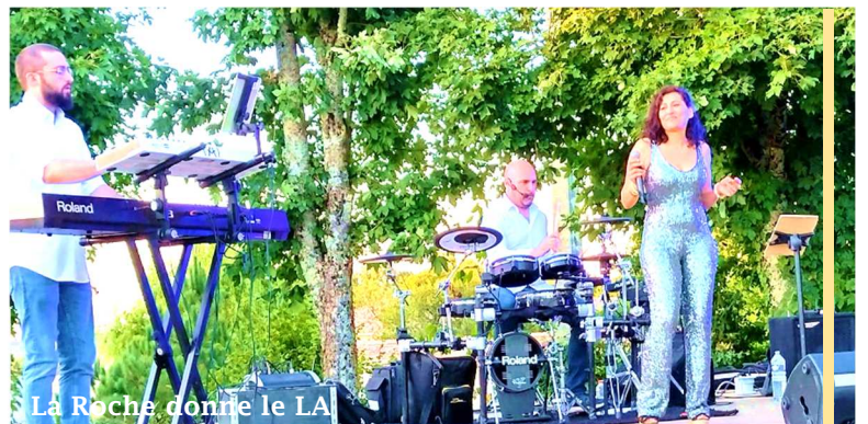
La Roche donne le LA