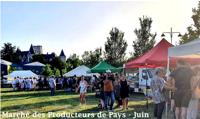
Marché des Producteurs de Pays - Juin