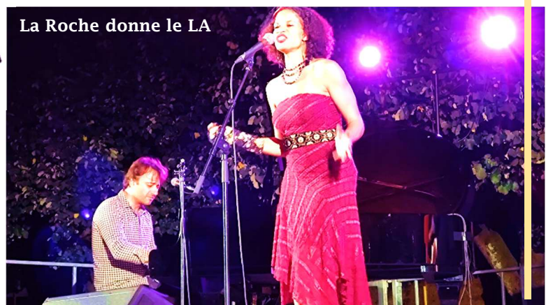
La Roche donne le LA