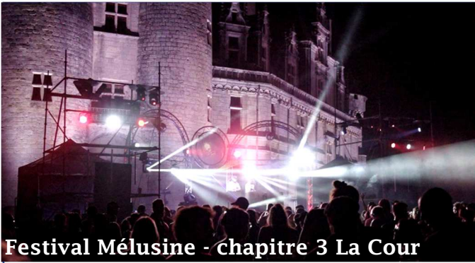
Festival Mélusine - Chapitre 3 La Cour

CONCOURS PHOTOS RENCONTRES MUSICALES CLASSIQUES