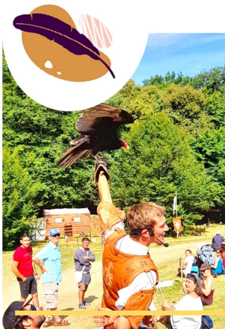
11 ème Fête Médiévale La Roche à Foucauld