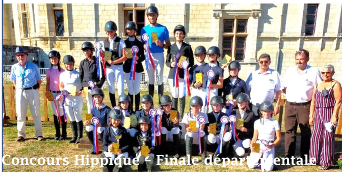
Concours Hippique - Finale départementale