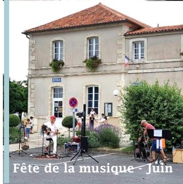
Fête de la musique - Juin