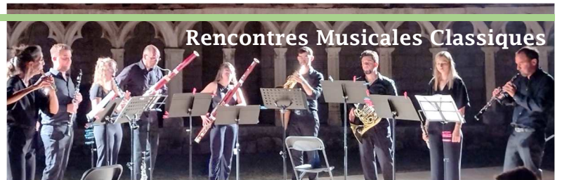
Rencontres Musicales Classiques