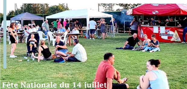
Fête Nationale du 14 juillet