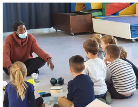
Atelier de sensibilisation au bruit dans les écoles. - octobre