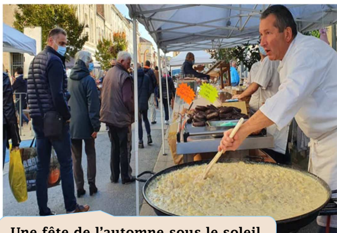
Une fête de l'automne sous le soleil et en musique ! - octobre