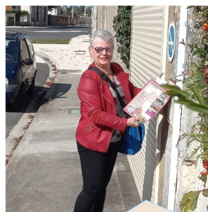
Distribution du magazine municipal - octobre