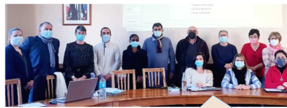
Les 9 agents recenseurs ont été accueillis en novembre à la mairie. Ils terminent leur mission le 19 février.