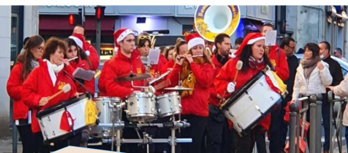
Animation de rue organisée avec la Banda de Chabonais invitée par la municipalité - décembre.