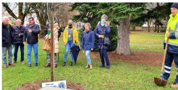
Plantation d'arbres fruitiers offerts par le Lion's Club, ici un cerisier dans le parc de l'hôtel de ville - novembre