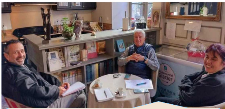
Création d'un nouveau festival de jazz en juillet. Fruit d'un partenariat entre la ville, les Carmes et le Patio de la Roche. Réunion de travail - novembre