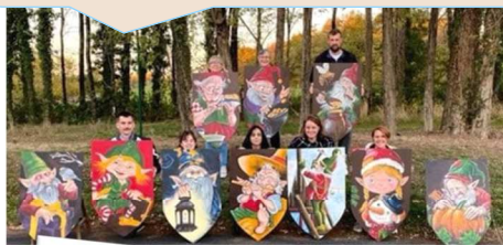
La fête de l'hiver des commerçants a mis du soleil en ville en fête le dimanche 12 décembre.