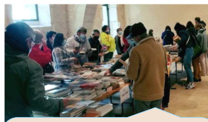
Plus de 1 000 livres ont trouvé preneur lors de la braderie de livres de la médiathèque en octobre !