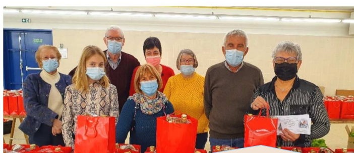
Les paniers garnis offerts par le CCAS aux habitants de la commune âgés de plus de 69 ans. Merci aux bénévoles ! - décembre